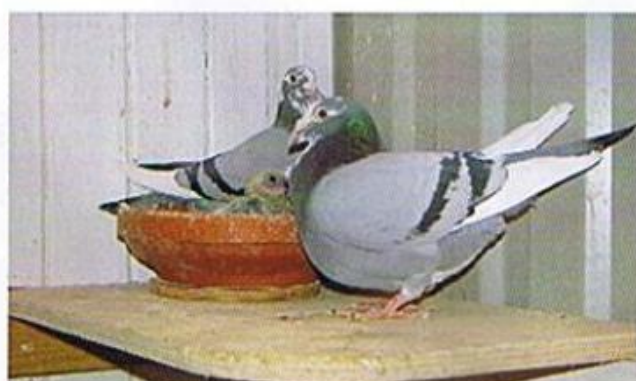
Die Eltern von „Naomi“

kehr werden sie nach zwei Stunden getrennt.