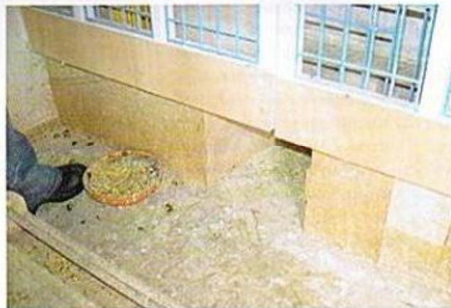
So werden die Reiseweibchen in ihre Zellen eingesperrt! Durch den Tunnel unten können die Tauben zueinander!

werschaft fliegenden Weibchen. Dazu gibt es einen kleinen Schlag für die Nesttauben. Hinter den Schlägen gibt es Volieren für die mit den Witvern und Reiseweibchen gepaarten Zuchttauben. Durch ein Türchen unterhalb der Zellen können diese zu ihren Partnern gelassen werden.