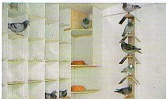
Blick in das Jungtierabteil

„Naomi“ stammt aus einer echten Leistungsfamilie. So ist ihr Vater, der