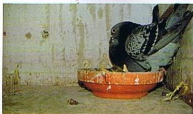
Die Übernachttauben werden vom Nest gespielt