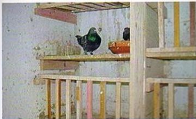
Das Abteil der Übernachttauben